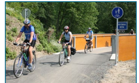
Cyklostezka Bečva byla pro Jihočechy velkou inspirací