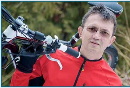
Nový maďarský cyklokomisař István Garancsi