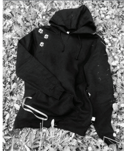
Mikina z biobavlny

Druhým místem, kde nakoupíte zajímavé výrobky z biobavlny, je Studio M.arta na Uhelné ulici. Zde kromě